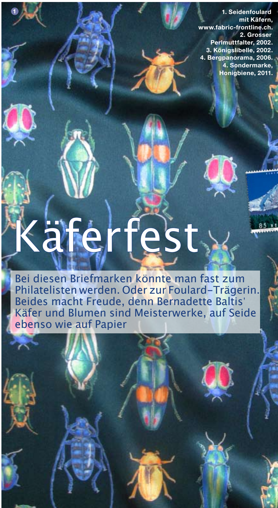
1. Seidenfoulard mit Käfern, www.fabric-frontline.ch . 2. Grosser Perlmutterfalter, 2002. 3. Königslibelle, 2002. 4. Bergpanorama, 2006. 4. Sondermarke, Honigbiene, 2011.