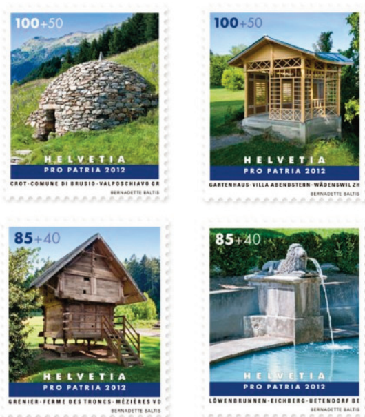
I quattro nuovi francobolli Pro Patria della serie Piccoli edifici svizzeri

Quello con il crotto di Brusio è uno dei quattro francobolli della nuova serie che Pro Patria dedica a piccole costruzioni svizzere con una rilevante importanza storica e artistica, testimoni di particolari competenze tecniche o artigianali. Gli altri tre raffigurano la Fontana del leone della proprietà Eichberg di Uetendorf (Berna), un granaio di Mézières (Vaud) e un piccolo padiglione del giardino di villa Abendstern a Wädenswil (Zurigo). I francobolli sono stati realizzati dall'artista e grafica zurighese Bernadette Baltis.