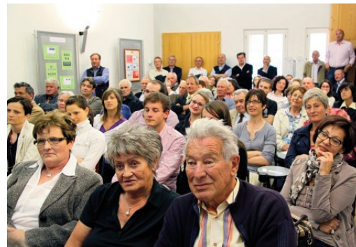
Numeroso pubblico in Casa Besta

I crotti della Valposchiavo attirano sempre più l'attenzione di interessati da tutta Europa, fra cui anche architetti rurali. Così ha riferito Dario Monigatti , conoscitore particolarmente esperto di queste costruzioni che non hanno eguali. Esistono solo in Valposchiavo e i primi risalgono al XVI secolo. Ha inoltre mostrato un filmato, realizzato nel 2000, che documenta l'intero processo di ricostruzione di un crotto a Irola: una preziosa testimonianza di come l'ingegno e le abili mani degli uomini di un tempo sapevano erigere queste cantine a forma semicircolare con cupola a falsa volta realizzate a secco, interamente in pietra, utilizzate per deporvi al fresco il latte e altre derrate alimentari.