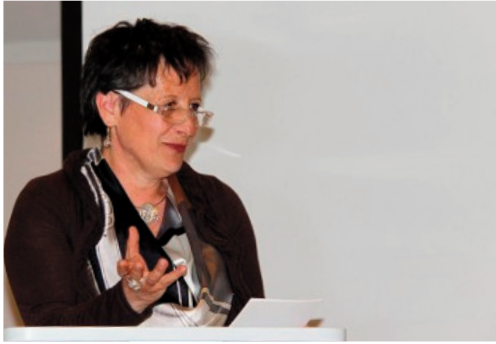
La presidente del Circolo Filatelico di Poschiavo